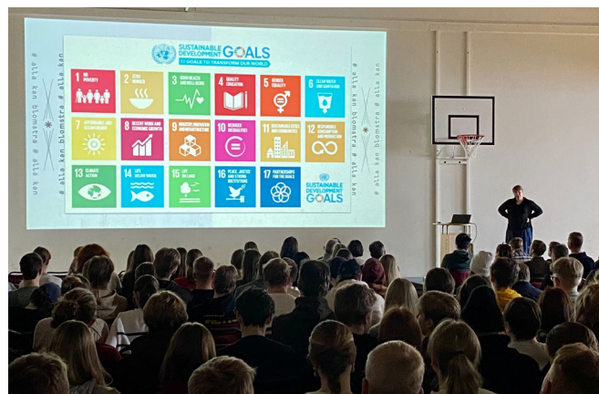
Temadag med hållbar utveckling