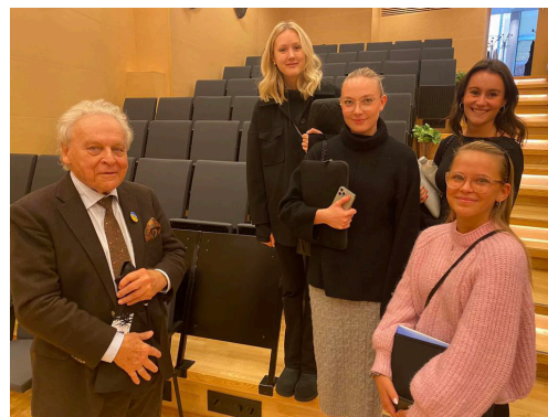
Journalisten och författaren Herman Lindqvist tillsammans med studerande.