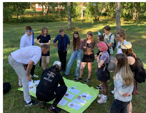
Lussedag för ÅK 1.