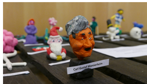
Temadag Finland 100 år - Skulpturer