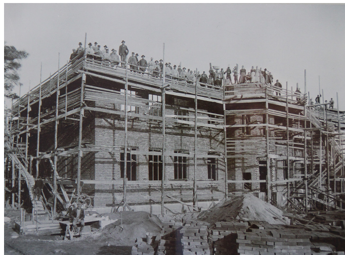
Realläroverket i Mariehamns uppbyggnad den 29 oktober 1902.

Den treklassiga privatskolan i Mariehamn övertogs av staten och sammanslogs med den tvåklassiga elementarskolan till ett femklassigt realläroverk för 120 år sedan. Det är den grund Ålands lyceum vilar på. Mycket har ändrat i skolan sedan dess men det allmänbildande uppdraget lever kvar. Pedagogiken och synen på studerande har dock förändrats under tidens gång. En radikal förändring är digitaliseringen som bl. a. innebär att nästa studentkull skriver alla studentprov digitalt. Det blir en stor utmaning inom ämnena matematik, fysik och kemi när formler och grafer ska produceras digitalt. Men kanske vi även ser en återgång till äldre pedagogiska metoder? Studentexamensnämnden flaggar för att den skriftliga examinationen ska ackompanjeras av en muntlig examination i vissa ämnen. Så var det förr i tiden. Den stora skillnaden är att den muntliga examinationsdelen kommer att ske digitalt. Gamla välbeprövade metoder tas upp men i en ny tappning. En ständigt pågående utveckling genomsyrar skolvardagen.