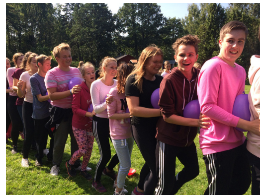
Introduktionsdag för studerande i åk 1 vid Lemböte lägergård.