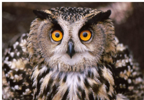
Porträtt av en berguv.