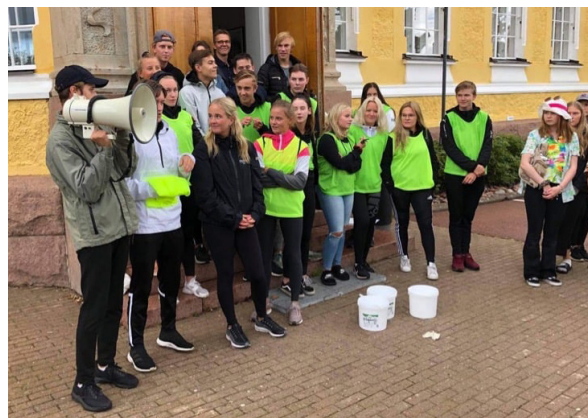
Introduktionsdagar för åk 1. Vi ställde inte in men vi ställde om pga Covid 19.