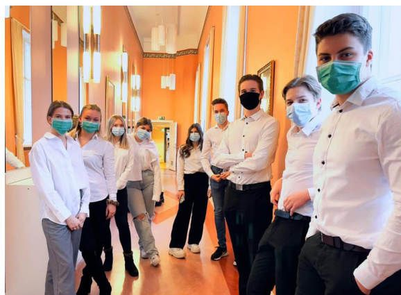
Sista vanliga dagen för abiturienterna. Vita skjortan är traditionsenligt på.