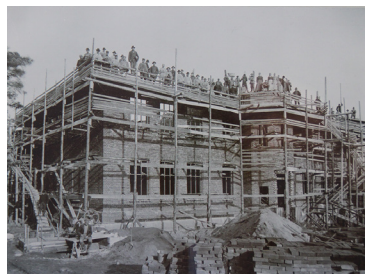
Realläroverket i Mariehamns uppbyggnad den 29 oktober 1902.

Skolan genomsyras av en ständigt pågående utveckling. Under läsåret har arbetet med en ny läroplan varit intensivt. Läroplanen tas i bruk 1.8.2021 och innehåller många förändringar där bland annat ökad internationalisering och samarbete med universitet och högskolor betonas. Framtiden får utvisa hur väl vi lyckats.