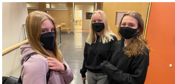
Studerande har hörsammat rekommendationer och uppmaningar. Alla drar sitt strå till stacken för att hålla sig friska.