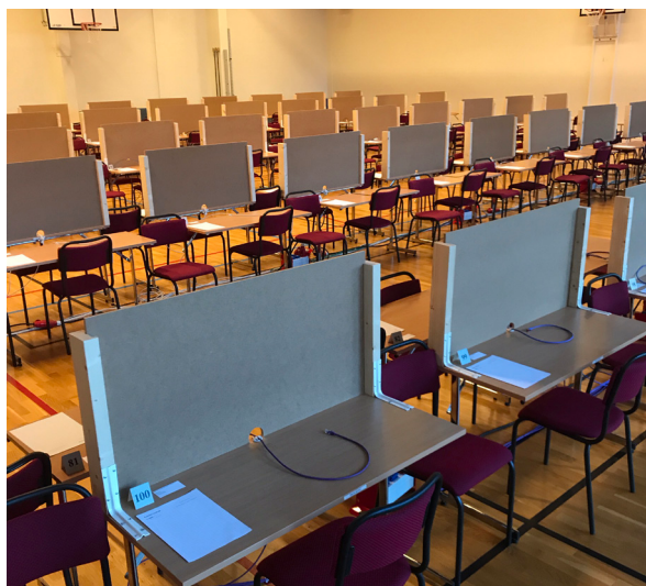
Höstens studentprov genomfördes lyckligtvis trots överliggande Covid-19 hot.