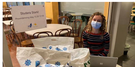
Studera Starkt, inlämning av salivprov.